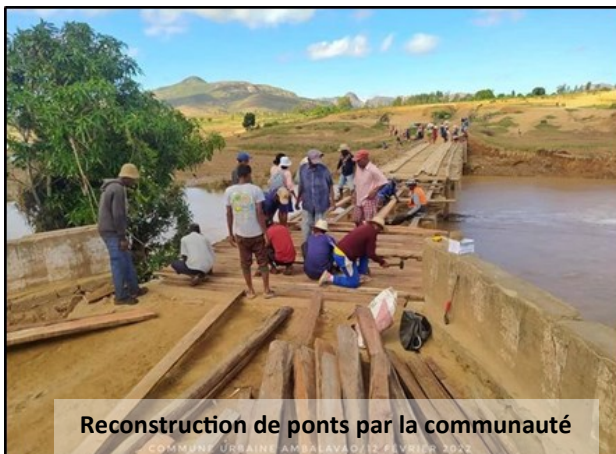
Reconstruction de ponts par la communauté

Mizara ne tient pas à se substituer à l'Etat, mais offre une