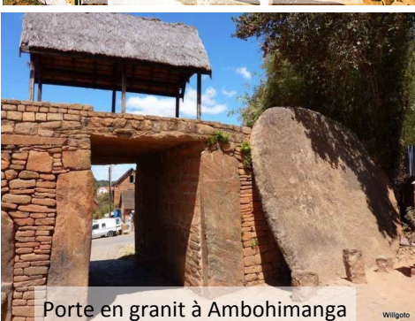
Porte en granit à Ambohimanga

Notre conseil est de partir de bon matin, de passer toute la journée à Ambohimanga et de repartir vers 18H pour éviter les bouchons, sinon, il y a de charmants hôtels pour y passer la nuit.