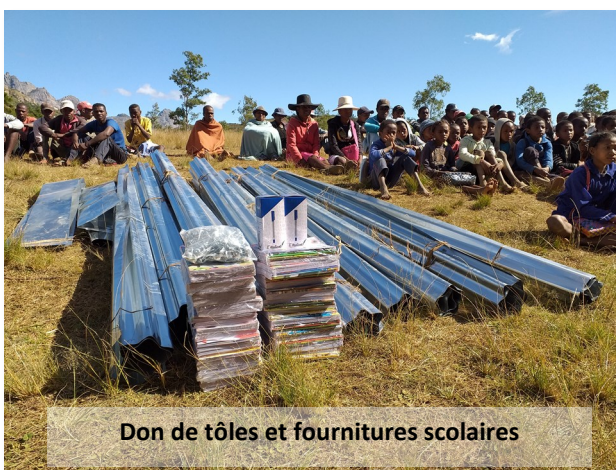
Don de tôles et fournitures scolaires

Mizara s'est chargée de l'appui financier par l'achat de tôles pour la remise en état d'un bâtiment, et des fournitures scolaires.