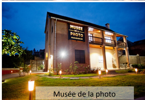
Musée de la photo

Le musée d'histoire naturelle Tsimbazaza (au rdc) occupe le même bâtiment que l'Académie Malagasy (à l'étage). Découvrez les fossiles et subfossiles des animaux qui peuplaient autrefois Madagascar, notamment l'oiseau géant Aepiornis (3 fois plus grand que l'autruche !), l'hippopotame nain, le crocodile herbivore, et le plus grand lémurien de tous les temps Archeoindris . Une autre salle d'exposition montre l'art de la coiffure, les tatouages et leurs significations.